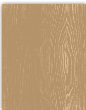
Original Wood 2 oldali 3D famintás