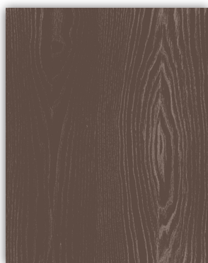
Dark Brown 2 oldali 3D famintás